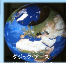
ダジック・アース