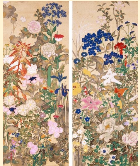
神坂雪佳《草花図》20世紀初頭 千總ホールディングス蔵