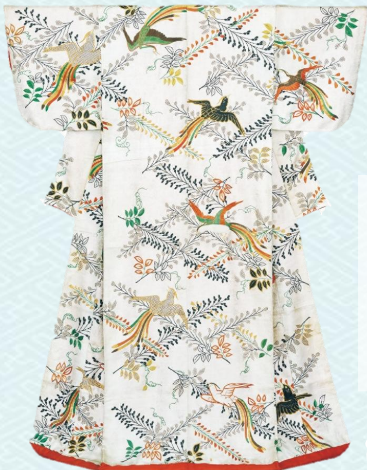
《打掛 白紬子地藤菱尾長鳥模様》18世紀後期-19世紀初期 千總ホールディングス蔵