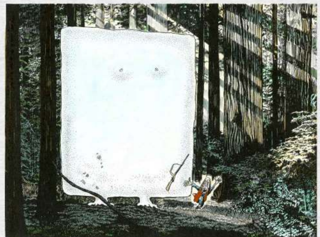
《塗壁》©水木プロダクション