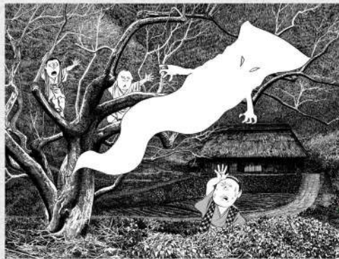
《一反木綿》©水木プロダクション

第1回: 5/13(水) 10:00~11:30 藁科生涯学習 センターにて講義