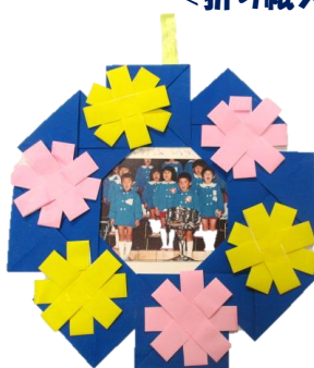
<折り紙フォトフレーム>