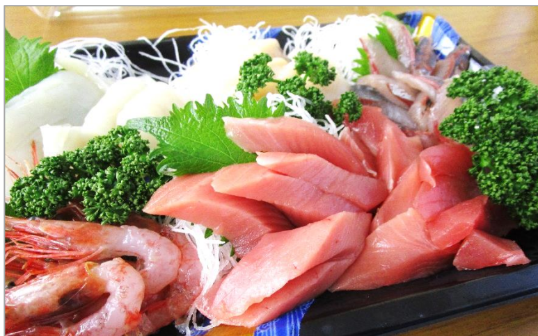
※昨年の講座の写真です