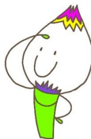
おかんじゃけ君 地域に伝わる郷土玩具 「おかんじゃけ」のキャラクター