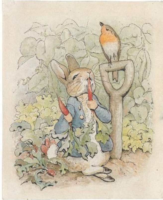
《『ピーターラビットのおはなし』挿絵原画》 ビATRIX・ポター 1902年

世界中でベストセラーとなっている「ピーターラビット」シリーズは今なお読み継がれています。