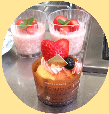
いちごのカップケーキ