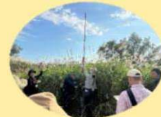
カヤネズミ調査の様子

東部生涯学習センターでは、 SDGs 目標 15「陸の豊かさを守ろう」 にちなみ、 麻機遊水地に生息するカヤネズミなどの絶滅危惧種を保全するため、 自然環境保護の普及啓発に力を入れて取り組んでいます。